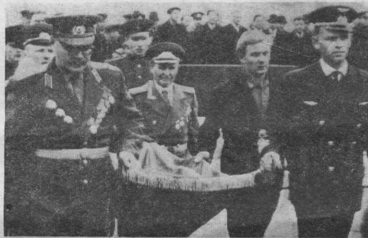
На развернутом знамени гильзу артиллерийского снаряда с замурованными в ней списками погибших воинов-тайгинцев кортеж обносит вдоль выстроившихся колонн.

Помните! Через века, через года,— помните! О тех, кто уже не придет никогда, помните!